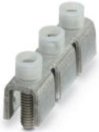
Fixed bridge, Number of positions: 3, Color: silver

Please be informed that the data shown in this PDF Document is generated from our Online Catalog. Please find the complete data in the user's documentation. Our General Terms of Use for Downloads are valid ( http://phoenixcontact.com/download )