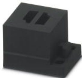
Small, slotted cable sleeves suitable for two AS-i cables, material: NBR, version: left, left

Please be informed that the data shown in this PDF Document is generated from our Online Catalog. Please find the complete data in the user's documentation. Our General Terms of Use for Downloads are valid ( http://phoenixcontact.com/download )