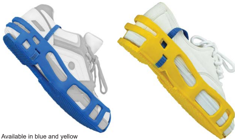
Available in blue and yellow