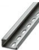
G-profile DIN rail, material: Steel, perforated, height 15 mm, width 32 mm, length 2 m