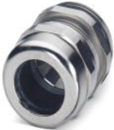
Cable gland, Cable gland material: Brass, nickel-plated, External cable diameter 19 mm ... 27 mm, Shielding: Yes, Connecting thread: M40, Color: silver

Please be informed that the data shown in this PDF Document is generated from our Online Catalog. Please find the complete data in the user's documentation. Our General Terms of Use for Downloads are valid ( http://phoenixcontact.com/download )