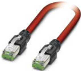
SERCOS III patch cable, shielded, star quad, AWG 22 stranded (7-wire), RAL 3020 (traffic red), RJ45 connector/IP 20, straight, to RJ45 connector/IP20, straight, length: 1.0 m

Please be informed that the data shown in this PDF Document is generated from our Online Catalog. Please find the complete data in the user's documentation. Our General Terms of Use for Downloads are valid ( http://download.phoenixcontact.com )