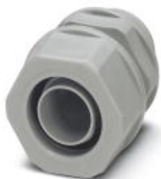
Cable gland made from PP with metric thread, IP65 protection

Please be informed that the data shown in this PDF Document is generated from our Online Catalog. Please find the complete data in the user's documentation. Our General Terms of Use for Downloads are valid ( http://phoenixcontact.com/download )