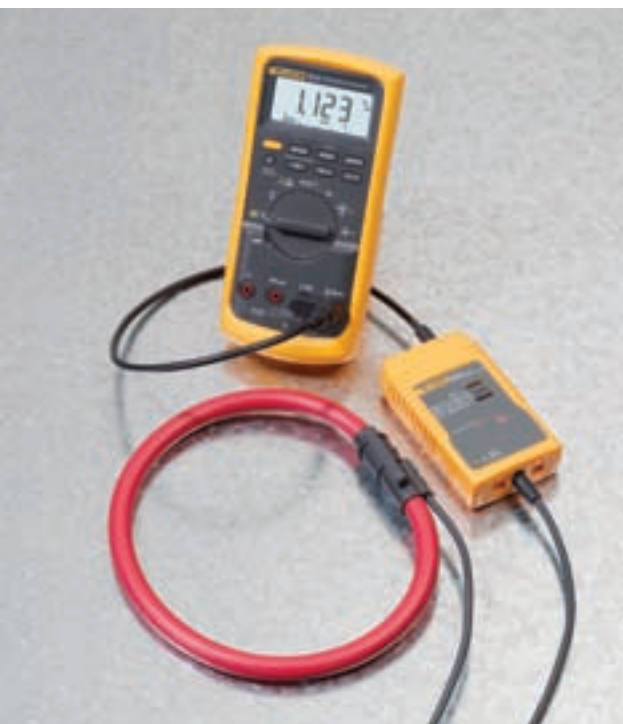
i2000 Flex connected to a Fluke 87V Digital Multimeter.

Fluke. Keeping your world up and running.™