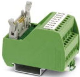
VARIOFACE Professional (VIP) module for Siemens ET200 ISP controllers

Please be informed that the data shown in this PDF Document is generated from our Online Catalog. Please find the complete data in the user's documentation. Our General Terms of Use for Downloads are valid ( http://phoenixcontact.com/download )