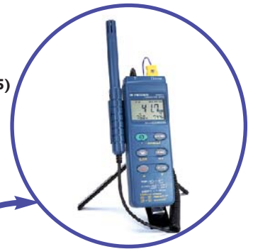
Tripod Mountable (tripod not included)