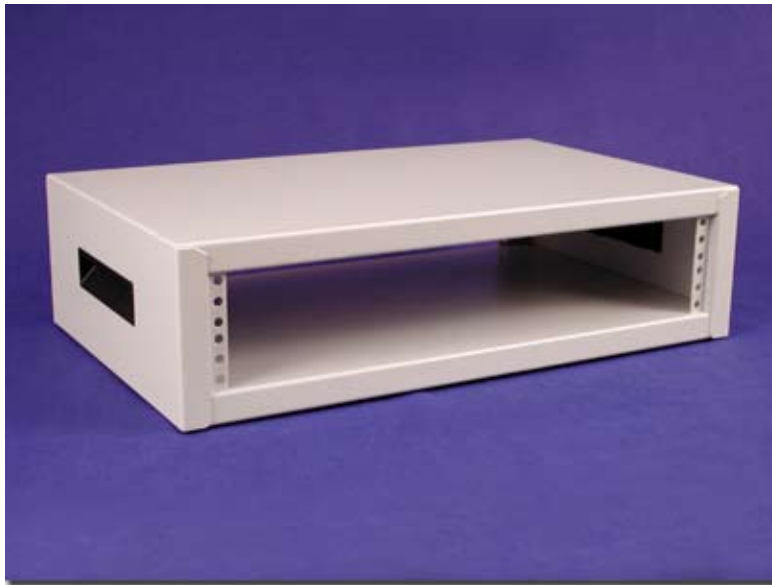
Light Gray (Textured)