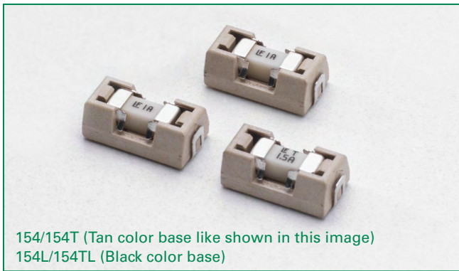
154/154T (Tan color base like shown in this image) 154L/154TL (Black color base)