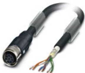
Bus system cable, VARAN, 6-position, PVC, black, shielded, cable length: 6 m, Customer version

Please be informed that the data shown in this PDF Document is generated from our Online Catalog. Please find the complete data in the user's documentation. Our General Terms of Use for Downloads are valid ( http://phoenixcontact.com/download )