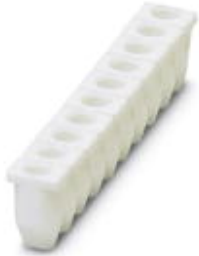
Insulating sleeve, Color: white

Please be informed that the data shown in this PDF Document is generated from our Online Catalog. Please find the complete data in the user's documentation. Our General Terms of Use for Downloads are valid ( http://phoenixcontact.com/download )