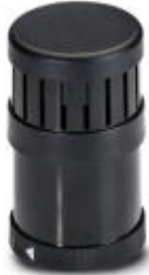
Siren element, pulse tone, 24 V DC, self-regulating volume, max. 100 dB(A), black

Please be informed that the data shown in this PDF Document is generated from our Online Catalog. Please find the complete data in the user's documentation. Our General Terms of Use for Downloads are valid ( http://phoenixcontact.com/download )