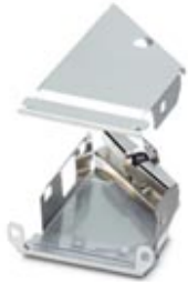
D-SUB EMC inner sleeve, shell size 3, for sleeve housing VS-25-...

Please be informed that the data shown in this PDF Document is generated from our Online Catalog. Please find the complete data in the user's documentation. Our General Terms of Use for Downloads are valid ( http://download.phoenixcontact.com )