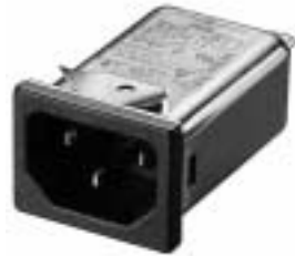
NG3QM (Optional wire type)