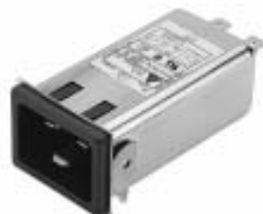
20GENG3E (Optional wire type)