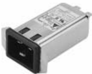
20GEEG3E (Optional wire type)