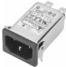
NG3QM(H) (Optional wire type)