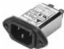
EG3BM EG3QM (optional wire type)