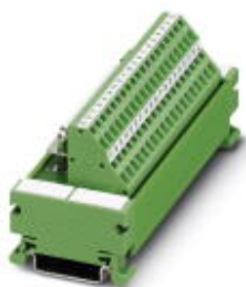
VARIOFACE module, with spring-cage connection and D-Subminiature socket strip, for mounting on NS 35/7.5, 37-pos.

Please be informed that the data shown in this PDF Document is generated from our Online Catalog. Please find the complete data in the user's documentation. Our General Terms of Use for Downloads are valid ( http://phoenixcontact.com/download )