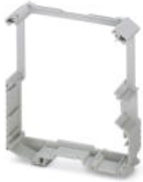
Complete housing, length: 99 mm, Central part, color: light gray, width: 22.5 mm

Please be informed that the data shown in this PDF Document is generated from our Online Catalog. Please find the complete data in the user's documentation. Our General Terms of Use for Downloads are valid ( http://phoenixcontact.com/download )