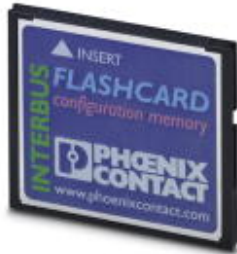
Program and configuration memory, plug-in, 256 MB

Please be informed that the data shown in this PDF Document is generated from our Online Catalog. Please find the complete data in the user's documentation. Our General Terms of Use for Downloads are valid ( http://download.phoenixcontact.com )