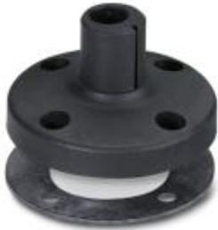
Foot for tube Ø 25 mm, plastic, black

Please be informed that the data shown in this PDF Document is generated from our Online Catalog. Please find the complete data in the user's documentation. Our General Terms of Use for Downloads are valid ( http://phoenixcontact.com/download )