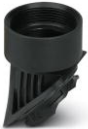
Adapter, plastic, for EVO housing, NPT 1 1/4 inch thread

Please be informed that the data shown in this PDF Document is generated from our Online Catalog. Please find the complete data in the user's documentation. Our General Terms of Use for Downloads are valid ( http://phoenixcontact.com/download )