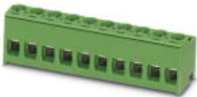
The figure shows a 10-position version of the product

PCB connector, nominal current: 10 A, number of positions: 7, pitch: 5 mm, connection method: Screw connection with tension sleeve, color: gray, contact surface: Tin