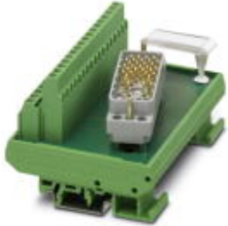
VARIOFACE module, for ELCO connector, for mounting on NS 35/7.5 or NS 32, with pin strip 8016 left, no. of positions 32

Please be informed that the data shown in this PDF Document is generated from our Online Catalog. Please find the complete data in the user's documentation. Our General Terms of Use for Downloads are valid ( http://phoenixcontact.com/download )