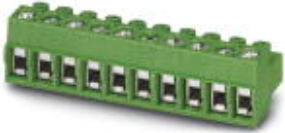
The figure shows a 10-position version of the product

PCB connector, nominal current: 12 A, number of positions: 2, pitch: 5 mm, connection method: Screw connection with wire protector, color: red, contact surface: Tin