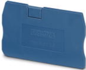
End cover, Length: 48.5 mm, Width: 2.2 mm, Height: 36.5 mm, Color: blue

Please be informed that the data shown in this PDF Document is generated from our Online Catalog. Please find the complete data in the user's documentation. Our General Terms of Use for Downloads are valid ( http://phoenixcontact.com/download )