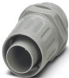
Cable gland made from PP with metric thread, rotatable, IP54 protection

Please be informed that the data shown in this PDF Document is generated from our Online Catalog. Please find the complete data in the user's documentation. Our General Terms of Use for Downloads are valid ( http://phoenixcontact.com/download )