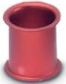
Adapter sleeve, Nominal current: 10 A, Color: red

Please be informed that the data shown in this PDF Document is generated from our Online Catalog. Please find the complete data in the user's documentation. Our General Terms of Use for Downloads are valid ( http://phoenixcontact.com/download )