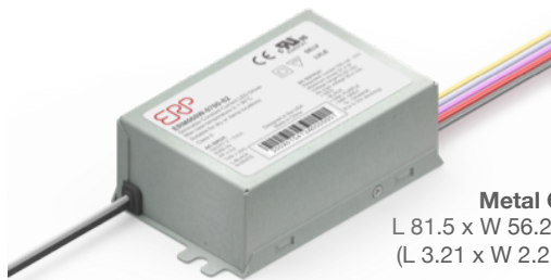
Metal Case L 81.5 x W 56.2 x H 31.5 mm (L 3.21 x W 2.21 x H 1.24 in)