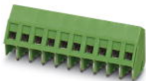
The figure shows a 10-position version of the product

PCB terminal block, nominal current: 17.5 A, nom. voltage: 400 V, pitch: 5.08 mm, number of positions: 8, connection method: Screw connection with tension sleeve, mounting: Wave soldering, conductor/PCB connection direction: 55 °, color: green