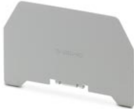
Separating plate, Color: gray

Please be informed that the data shown in this PDF Document is generated from our Online Catalog. Please find the complete data in the user's documentation. Our General Terms of Use for Downloads are valid ( http://download.phoenixcontact.com )