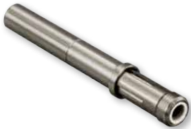
181-075 Socket Terminus