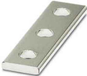
Connection rail, Number of positions: 3, Color: silver

Please be informed that the data shown in this PDF Document is generated from our Online Catalog. Please find the complete data in the user's documentation. Our General Terms of Use for Downloads are valid ( http://download.phoenixcontact.com )