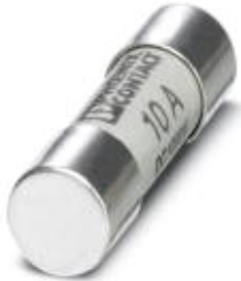
Fuse, 10.3x38 mm, up to 1000 V DC, gPV characteristics

Please be informed that the data shown in this PDF Document is generated from our Online Catalog. Please find the complete data in the user's documentation. Our General Terms of Use for Downloads are valid ( http://download.phoenixcontact.com )