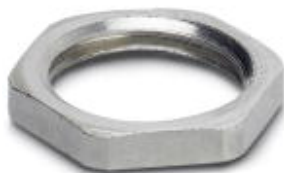
Flat nut with M16 thread

Please be informed that the data shown in this PDF Document is generated from our Online Catalog. Please find the complete data in the user's documentation. Our General Terms of Use for Downloads are valid ( http://download.phoenixcontact.com )