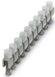
Fixed bridge, Number of positions: 10, Color: silver

Please be informed that the data shown in this PDF Document is generated from our Online Catalog. Please find the complete data in the user's documentation. Our General Terms of Use for Downloads are valid ( http://download.phoenixcontact.com )