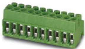
The figure shows a 10-position version of the product

PCB connector, nominal current: 8 A, number of positions: 8, pitch: 3.5 mm, connection method: Screw connection with wire protector, color: black, contact surface: Tin