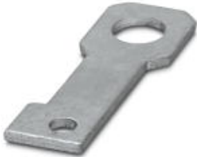
Plate for fixing the FLT-ISG-100-EX isolating spark gap to a flange, drill hole diameter of 22 mm.

Please be informed that the data shown in this PDF Document is generated from our Online Catalog. Please find the complete data in the user's documentation. Our General Terms of Use for Downloads are valid ( http://phoenixcontact.com/download )