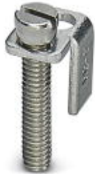
Switching jumper, Number of positions: 2, Color: silver

Please be informed that the data shown in this PDF Document is generated from our Online Catalog. Please find the complete data in the user's documentation. Our General Terms of Use for Downloads are valid ( http://phoenixcontact.com/download )