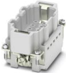
HEAVYCON pin insert, for 830 V (III/3), with 3 N/O contacts and 2 switch contacts, crimp connection

Please be informed that the data shown in this PDF Document is generated from our Online Catalog. Please find the complete data in the user's documentation. Our General Terms of Use for Downloads are valid ( http://phoenixcontact.com/download )