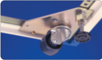
Caster installed with jacking foot