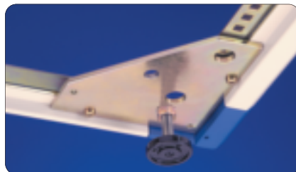
Universal corner bracket with jacking foot standard with frame type 'A' & 'B'

Each Caster Kit includes four (4) locking casters and hardware.