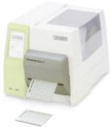
Cutter, for the THERMOMARK ROLL X1

Please be informed that the data shown in this PDF Document is generated from our Online Catalog. Please find the complete data in the user's documentation. Our General Terms of Use for Downloads are valid ( http://download.phoenixcontact.com )