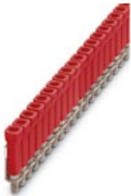
Jumper, Number of positions: 100, Color: red

Please be informed that the data shown in this PDF Document is generated from our Online Catalog. Please find the complete data in the user's documentation. Our General Terms of Use for Downloads are valid ( http://download.phoenixcontact.com )