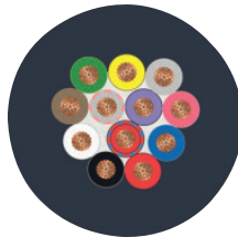
Cable cross section