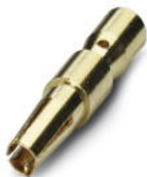
Crimp contact, turned, contact diameter: 1.5 mm, crimp range: 0.08 mm 2 ... 0.22 mm 2

Please be informed that the data shown in this PDF Document is generated from our Online Catalog. Please find the complete data in the user's documentation. Our General Terms of Use for Downloads are valid ( http://phoenixcontact.com/download )