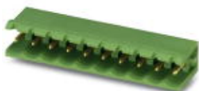
The figure shows the standard item

PCB headers, nominal current: 12 A, number of positions: 5, pitch: 5.08 mm, color: Agate gray, contact surface: Gold