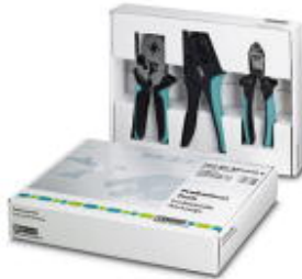
Tool set, equipped

Please be informed that the data shown in this PDF Document is generated from our Online Catalog. Please find the complete data in the user's documentation. Our General Terms of Use for Downloads are valid ( http://download.phoenixcontact.com )