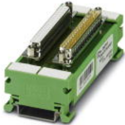
VARIOFACE termination board, with a 37-pos. D-SUB socket strip to a 37-pos. D-SUB pin strip, 1:1 connection

Please be informed that the data shown in this PDF Document is generated from our Online Catalog. Please find the complete data in the user's documentation. Our General Terms of Use for Downloads are valid ( http://phoenixcontact.com/download )