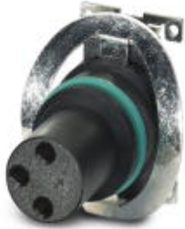
Flush-type connector, 3-position, SocketLink:straightLink:M8, A-coded, PCB mounting, SMD

Please be informed that the data shown in this PDF Document is generated from our Online Catalog. Please find the complete data in the user's documentation. Our General Terms of Use for Downloads are valid ( http://phoenixcontact.com/download )