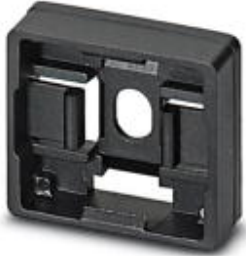
Marker carriers, black, unlabeled, Mounting type: Screws, rivets, Lettering field: 17 x 15 mm

Please be informed that the data shown in this PDF Document is generated from our Online Catalog. Please find the complete data in the user's documentation. Our General Terms of Use for Downloads are valid ( http://phoenixcontact.com/download )